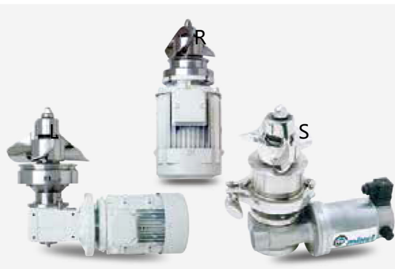
R系列 (快速)、L系列 (慢速)、S系列 (特殊) 容量从20-40000公升不等