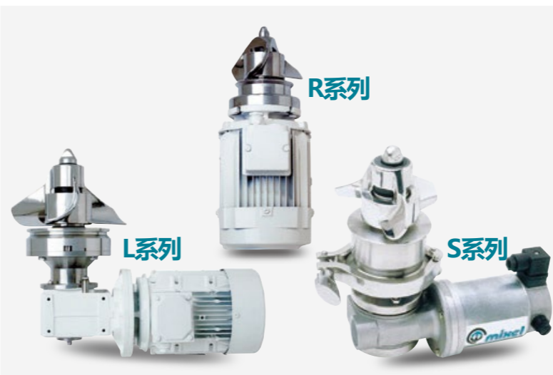
R系列 (快速)、L系列 (慢速)、S系列 (特殊) 容量从20-40000公升不等